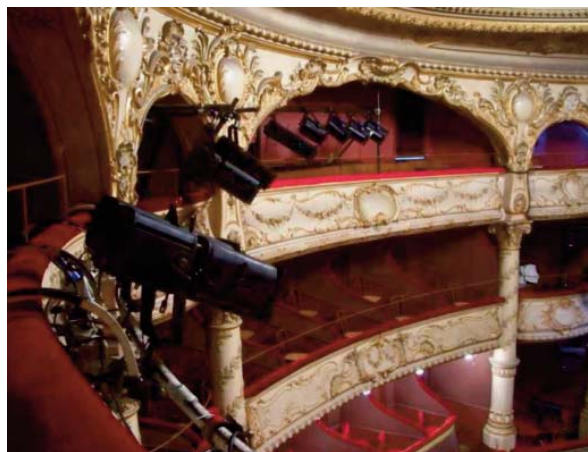
3ème balcon Détail des loges - jardin