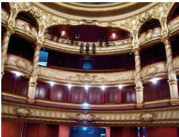
3ème balcon Poulailler et loges cour et jardin